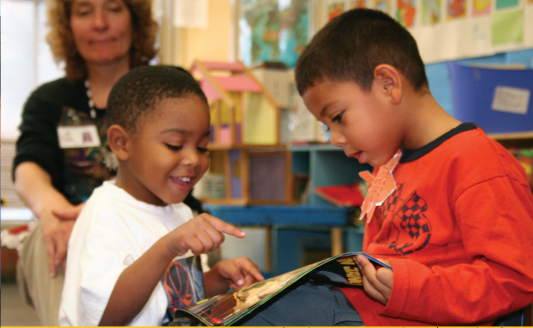
Trẻ em học tại trung tâm phát triển sớm cho trẻ