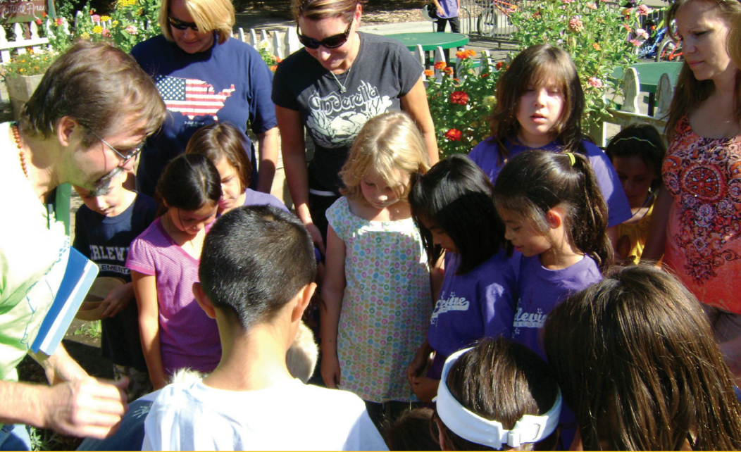
Các gia đình tham gia trong vườn họa công đồng Q W. Frlowing